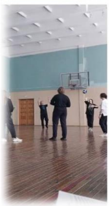
День 4 Игры наших родителей